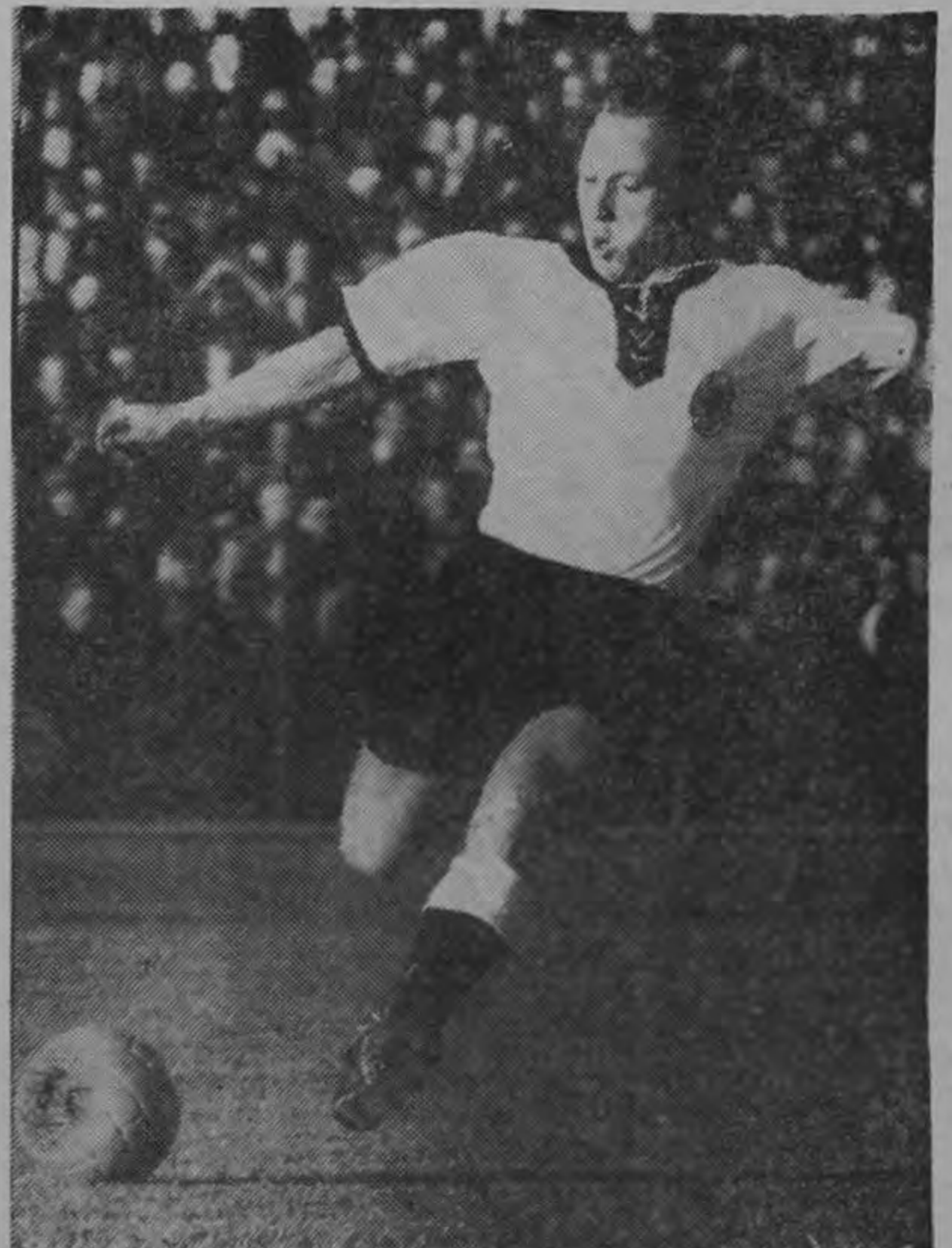
Wee Seeler formidable centro delantero de la selección alemana fue el autor ayer del gol del triunfo para su equipo en el difícil partido frente a la selección española. Fue el tercer triunfo consecutivo de los teutones ya clasificados para cuartos de final. El sábado tendrán que vérselas con Uruguay, ambos invictos hasta la fecha